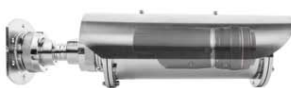
Geniş iç hacim